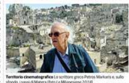
Territorio cinematografico lo scrittore greco Petros Markaris è sulla strada, i Sassi di Matera

● Come da tradizione, la rassegna si dipana in cornici, dal cinema all'arte al teatro. Per esempio dal 2 al 4 luglio torna il Viaggio in Italia alle Gallerie di piazza Scialoja di Intesa Sanpaolo ● Tornerà anche gli Aperiodici in città dal 12 e 13 e 14 e 15 e 16 e 17 e 18 e 19 luglio ● Riproposto la sezione Carta Bianca a cura di Lingiardi e Postagatti quest'anno quest'anno Petros Markaris e Teo Angelopoulos Traduzione di Andrea Di Gregorio